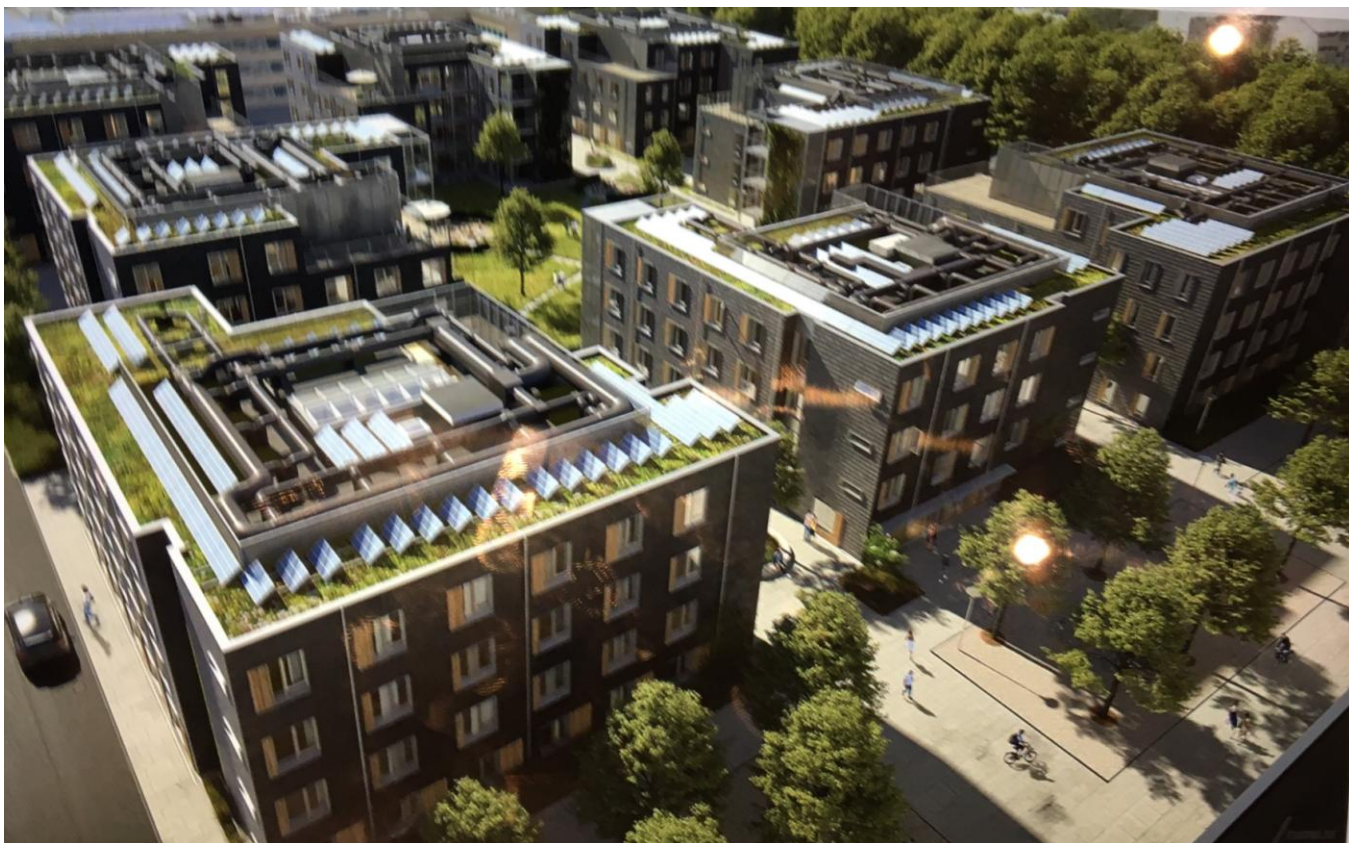
Illustration fra Lokalplan 270 for et område på Lundtoftevej 160, den såkaldte Atlasgrund. Bygningskultur Foreningen har i sin indsigelse til lokalplanen bl.a. skrevet: "Der er mange positive elementer i lokalplanforslaget, som understøtter det campuspræg, som (endnu) er karakteristisk for DTU-området. Men vi finder, at bebyggelsesprocenten er for høj, og at bebyggelsen dermed vil fremtræde for kompakt med nære friarealer med begrænset brugsværdi".