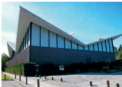
82 Virumhallen, Geels Plads 40