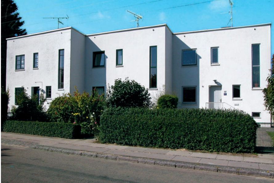
52 Hasselvej 26-30

Fine eksempler på modernistisk byggeri findes på I. H. Mundts Vej 16 [54], der blev opført i 1924. I. H. Mundts Vej 4B [56] opført i 1957 og Bellevue Strandbad [57] opført i 1932 er tegnet af Arne Jacobsen.