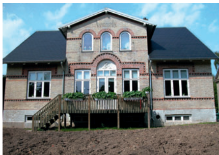
33 Vennely, Kongevejen 49

Etagehusene var udtryk for, at de velbeliggende grunde langs Lyngby Hovedgade var blevet dyrere og