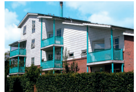
86 Astilbehaven på Virumgårds jorder

Bebyggelsen Gyvelholm [85] ved Furesøen er opført i 1997 i to etager med 47 boliger i gule mursten. Bebyggelsen har vandrette røde murstensbånd og rødt tegltag. Boligerne er forsynet med store altaner i