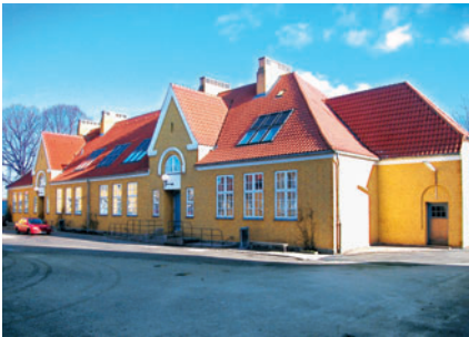
76 Engelsborgskolen, Engelsborgvej 66

kirken er opført af tilhugne kampesten (marksten) i midten af 1100-tallet. Resten af kirken er med få und-