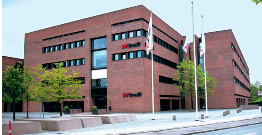
95 Hartmann/BRF Kredit, Klampenborgvej 203-205

Pihl & Søns domicil [96] på Nybrovej 116 opført i 1993/94 er i blank mur med røde sten og med meget