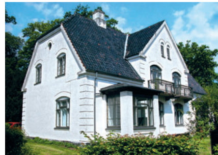
32 Mestervilla, Brede Allé 62-63