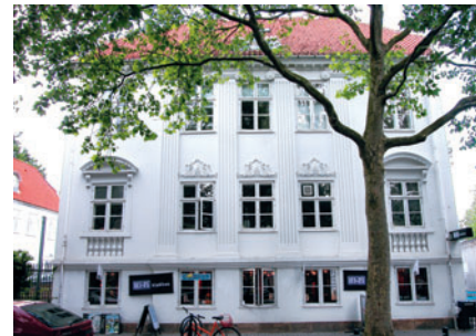
24 Det hvide Palæ, Lyngby Hovedgade 37