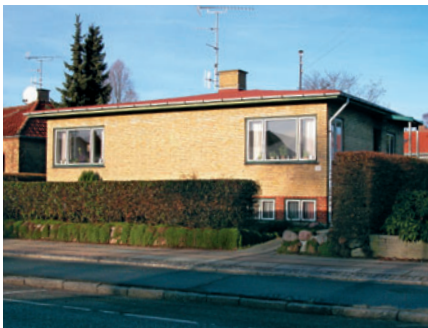
58 Christian X's Allé 108