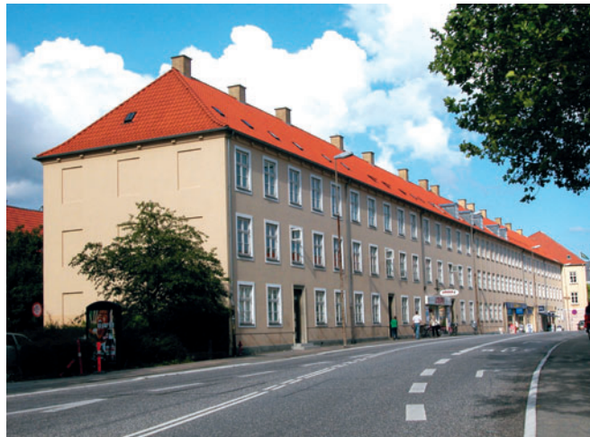
37 Toftebækhus, Lyngby Torv

skulle udnyttes mere intensivt for at forrente sig. Den samme tendens kunne ses på Taarbæk Strandvej, hvor Taarbæk Kro i 1870'erne blev til Taarbæk Hotel med en treetages bygning. Etagehusene langs gaderne gav et tydeligt købstadspræg, og i 1880'erne var dette købstadspræg mere fremtrædende i Taarbæk end i Lyngby.