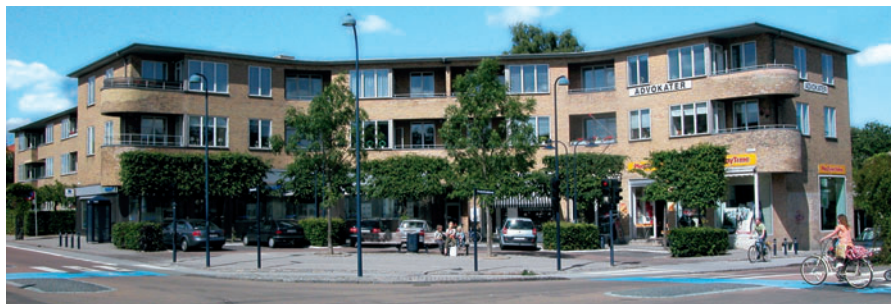
51 Virum Torv