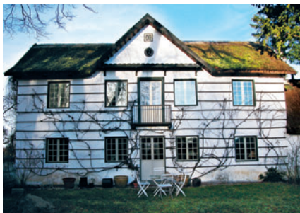
99 Spurveskjul 4

Kommunalbestyrelsen kan udpege bygninger som bevaringsværdige i kommuneplanen eller ved at vedtage et forbud mod nedrivning i en lokalplan eller en byplanvedtægt. Der er ingen kvalitetskriterier forbundet med udpegningen som bevaringsværdig, så kommunalbestyrelsen kan godt gennem planlægningen tilgodesse eksempelvis bymiljøer, hvor ikke alle elementer i helheden