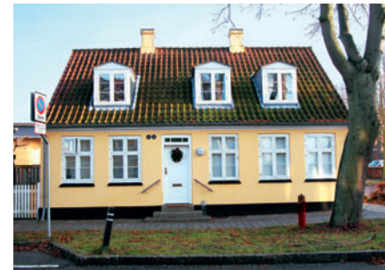
13 Peter Lunds Vej 2A