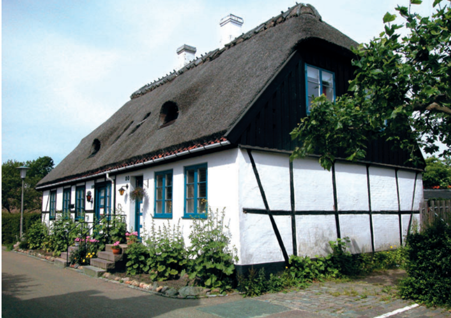
14 Asylgade 13

Traditionen med tofamiliehuse blev bevaret, og adskillige smukke tofamiliehuse er bygget så sent som i 1920'erne i Bondebyen, bl.a. Toftegærdet 18 [15], og i Ulrikkenborgkvarteret.