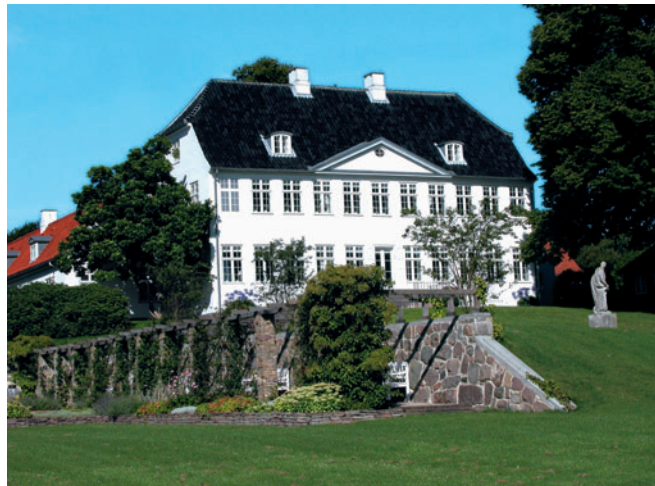
22 Marienborg, Nybrovej 410

facadens frodige ornamentik, dog med en mindelse om barokken i den iøjnefaldende gavlkvist.