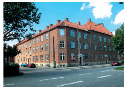
40 Belgien, Lyngby Hovedgade 102