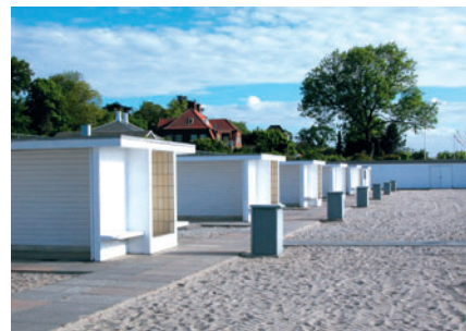
57 Bellevue Strandbad