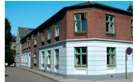
78 Kommunebygningen, Kirkestræde/Åstræde