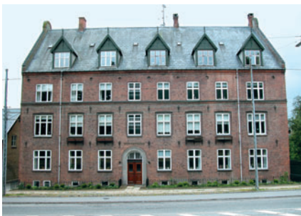
39 Sorgenfrihus, Lyngby Hovedgade 8A