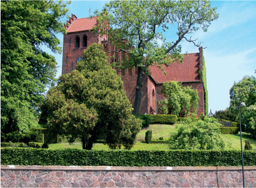
75 Lyngby Kirke