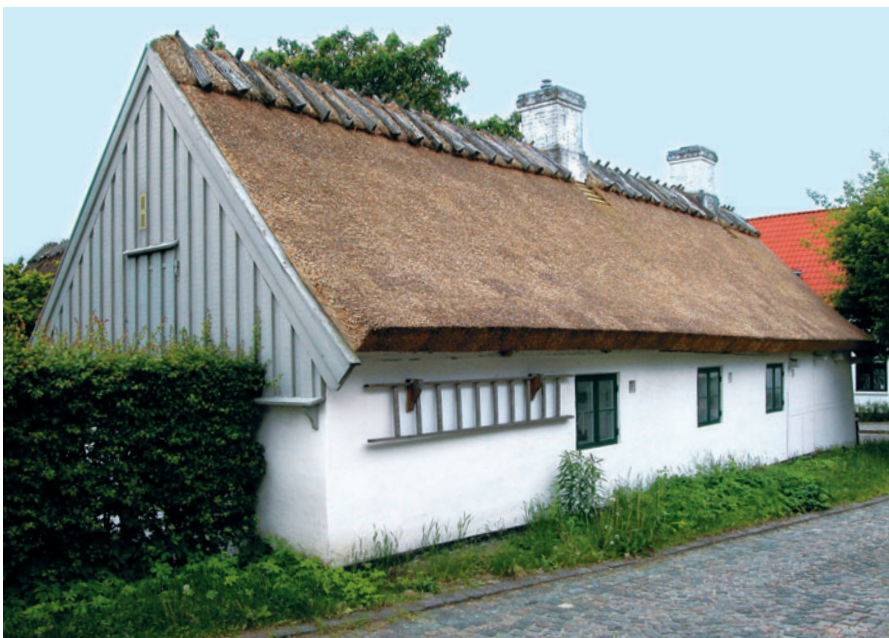
16 Nørregade 10