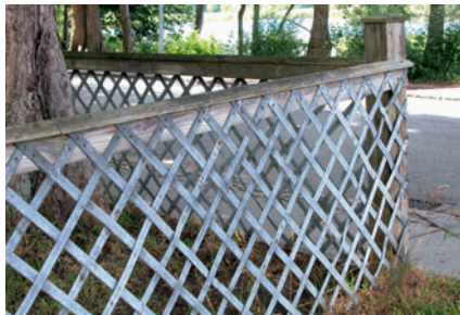
103 Stakit ved Brede Spisehus, I.C. Modewegs Vej

Pligten påhviler ikke blot dem, der ejer eller anvender bygningerne og de grønne områder. Vi har alle et medansvar for, at de kulturelle værdier ikke går tabt pga. uvidenhed eller kortsigtede løsninger. Ved at følge og eventuelt søge at påvirke de