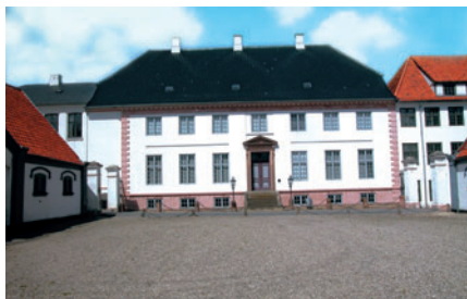
30 Brede Værks hovedbygning, I.C. Modewegs Vej

Der kom for alvor gang i industriproduktionen, da Dansk Gardin og Tekstil Fabrik opførte de første bygninger i 1892-93 ved Mølleåen på Gl. Lundtoftevej 1 [27], og den bestod i 1912 af tre bygninger. Den østligste brændte i 1960, men bygningen ved åen og mellembygningen ligger endnu tilbage. De er det sidste vidne om Lyngbys industris storhedstid.