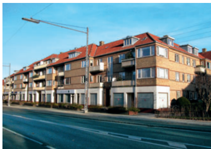
55 Helleholm, Grønnevej 79-85