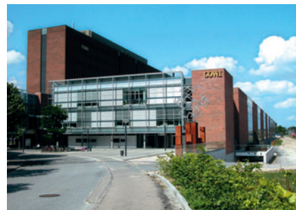
9 Cowi/Tryg, Parallelvej