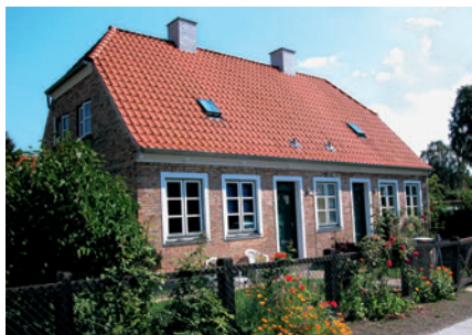
15 Toftegærdet 18