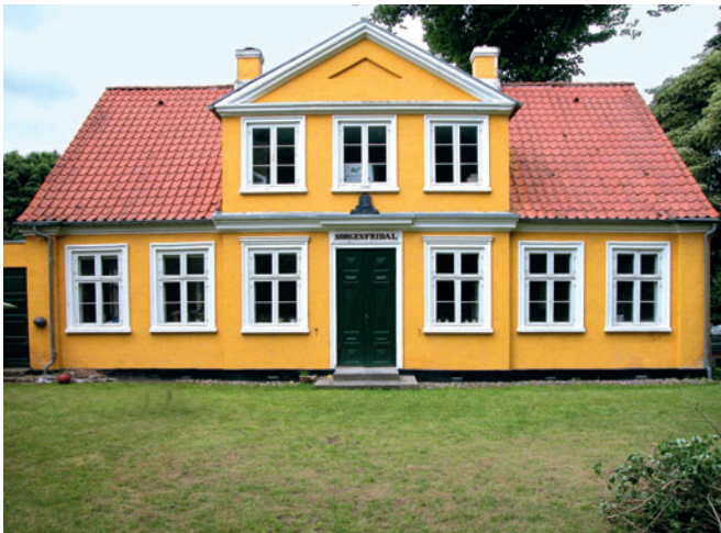
36 Sorgenfridal, Lyngby Hovedgade 6