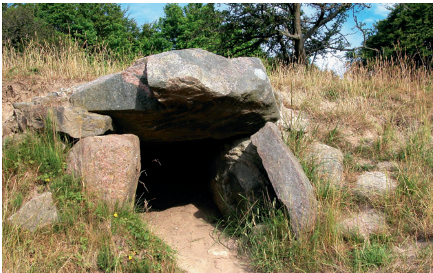
2 Gravhøj i Dyrehaven ved Christiansholmsvej

For ca. 1.000 år siden blev de første vandmøller etableret i Mølleå-dalen til at male mel.