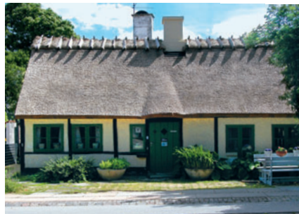
12 Virumvej 135A