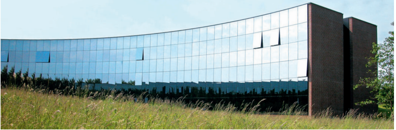
91 IBM Danmark, Nymøllevej 91