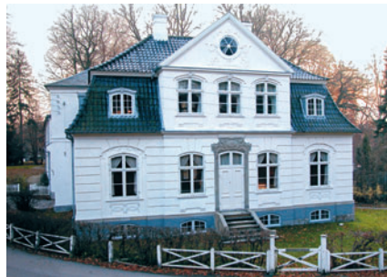
20 Friboeshvile, Lyngby Hovedgade 2

bygninger fra renæssancen fra 1530-1660, mens barokken, der var på mode fra 1660-1730, i dag er repræsenteret af blot to bygninger, nemlig landstedet Gammel Rustenborg på Rustenborgvej 3 [19] og Ørholm Hovedgård på Ørholmvej 61 [17], som begge er opført i første halvdel af 1700-tallet. Karakteristisk for barokken er bl.a. den høje, markante gavlkvist.