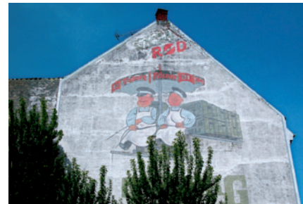
104 Gavlmaleri, Lyngby Hovedgade 26

planer, der lægges for nybyggeri, renovering, nedrivning eller andre fysiske indgreb i det bestående kan vi selv være med til at præge bygningskulturen i vores kommune. Jo mere opmærksomme vi er, og jo mere viden vi har, jo større vægt kan