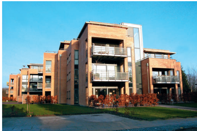
88 Rønne Allé 12-18