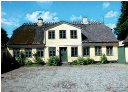
11 Kærgården, Virumgade 24

De tidlige byhuse i 1800-tallet blev opført i grundmur, bl.a. fordi de var mere brandsikre end bindingsværkshuse. For at spare på materialerne var de ofte tofamiliehuse, hvor