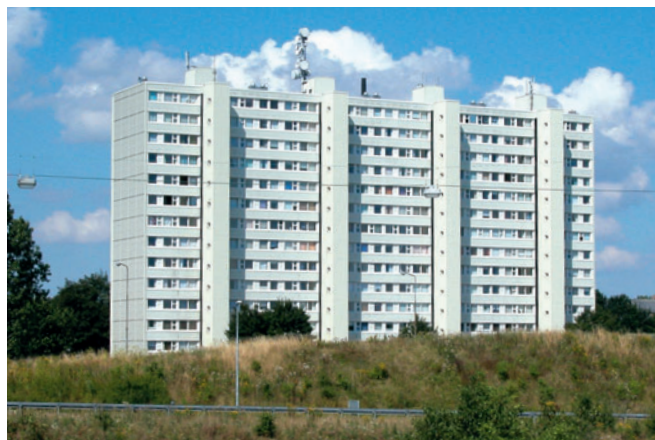
69 Lyngby Højhus, Lundtoftegårdsvej 5-11