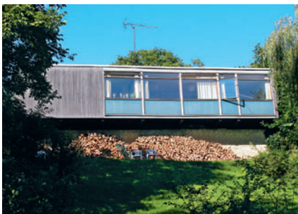
56 I. H. Mundts Vej 4B