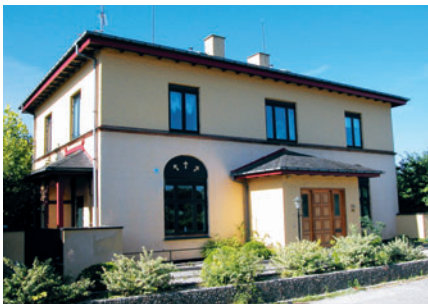
41 I. H. Mundts Vej 24