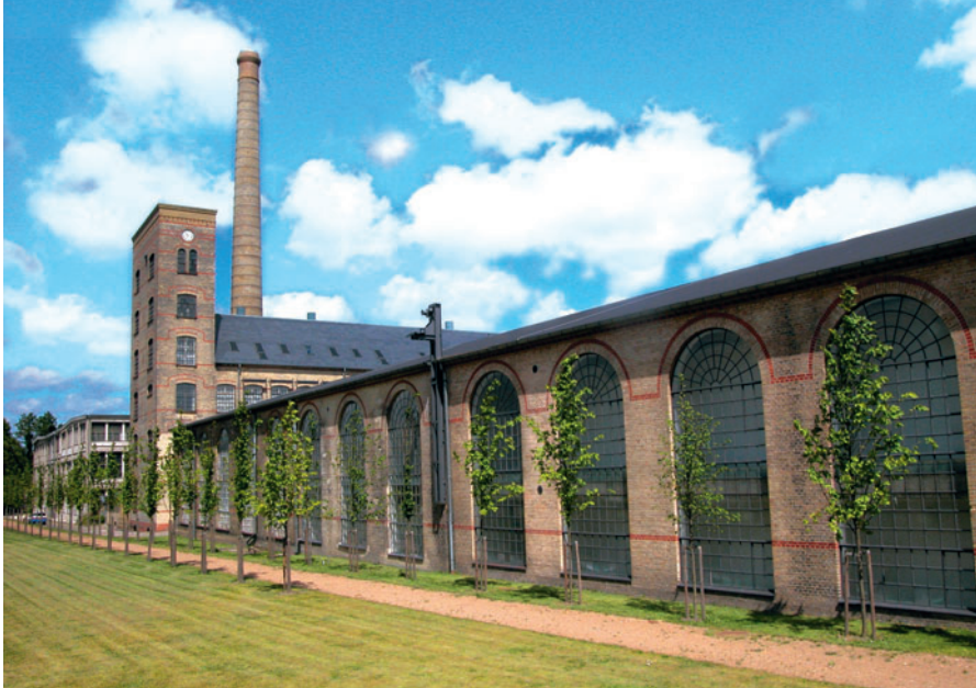
29 Brede fabriksbygning, I.C. Modewegs Vej

I 1913 opførte Dansk Gardin og Tekstil Fabrik fire ens dobbelthuse for funktionærer på Lundtoftevej 51-59 med blank mur i røde sten og med trækvist. I 1917 opførte den tre omtrent ens bebyggelser med arbejderboliger på Hyldehavevej 1 og Lundtoftevej 43 og 47 [28] med gulpudset mur og rødt tegltag. Disse