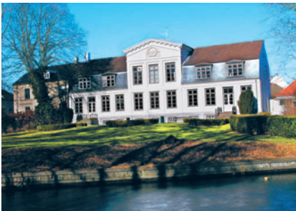
19 Gammel Rustenborg, Rustenborgvej 3

Den europæiske arkitektur i 1600- og 1700-tallet vandt indpas i