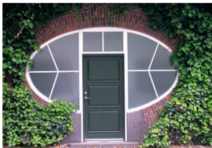
98 Kloakpumpestation, Gl. Lundtoftevej

Der er 98 fredede bygninger i Lyngby-Taarbæk i 2005. 28 ligger i Brede og 22 i Raadvad, mens de resterende 48 ligger spredt i resten af kommunen f.eks. Spurveskjul [99]