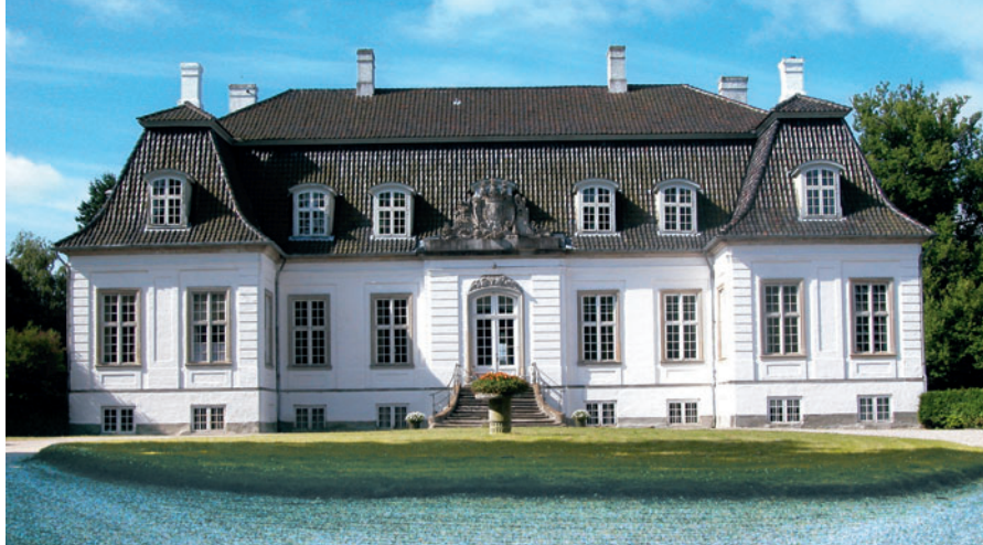
6 Frederiksdal Slot

I 1890'erne blomstrede industrien op og skabte et stort behov for nye boliger. Derfor blev der omkring