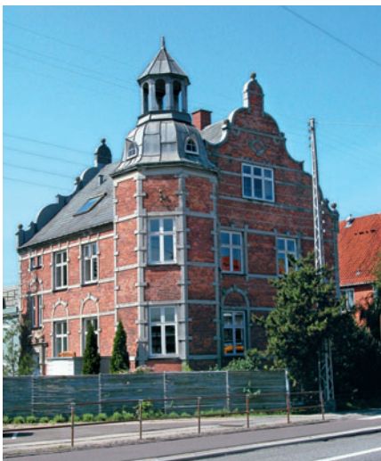
42 Lille Rosenborg, Bagsværdvej 65