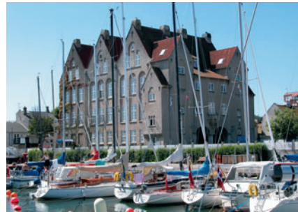
77 Taarbæk Skole, Taarbæk Strandvej 96

tagelser bygget omkring 1500-tallet. Overgangen mellem de to byggeperioder ses bl.a. på sydturen [3].