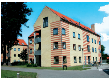
89 Rørdams Have ved Jægersborgvej

i 2002 bygget fire punkthuse med 44 boliger i tre etager og med penthuse. Bebyggelsen er opført i røde mursten med partier af metal og træ. Boligerne har store altaner i stål.