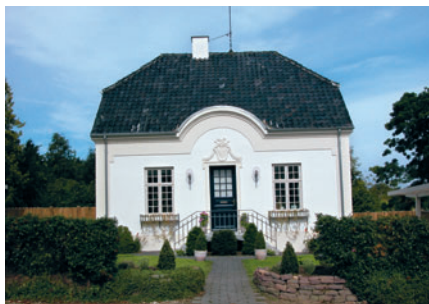
47 Sophus Schandorphs Vej 18

Amalie Vej 15, 42B, 70 og 74, der er opført i 1912-17, og på Lyngby Hovedgade 9 (Brohus), der er opført i 1925.