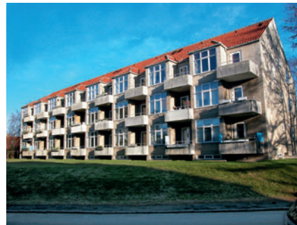
72 Lyngby Søpark, Agnetevej 8-14

bebyggelsen isoleret udvendigt og blev stedvis forhøjet med en etage.