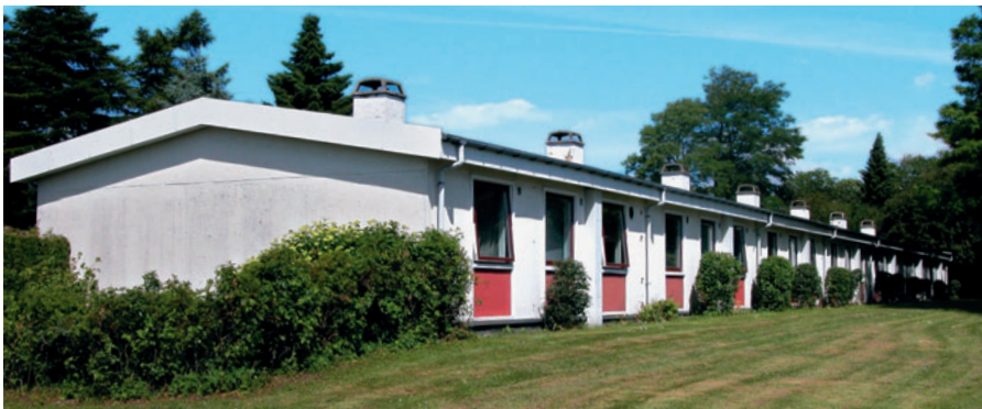
60 Elementbyen, Bjælkevangen

Lyngby-Taarbæk var blandt de omegnskommuner, der havde mest nybyggeri i gang under besættelsen. Det drejede sig om rækkehuse og parcelhuse, hvorimod etagebyggeriet næsten gik i stå, fordi der ikke kunne skaffes armeringsjern til etageadskillelsernes betondæk. Husene var små og fornuftige, opført af hjemlige materialer som træ og tegl. 1930'ernes eksperimenter med flade tage, jernrammede vinduer og nye konstruktioner var lagt på hylden.