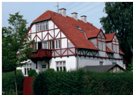
44 Rustenborgvej 12B

Nyrenæssancen (ca. 1900-1910) er karakteriseret ved brugen af blank mur i røde mursten lige som nationalromantikken, men med dekorative træk fra renæssancen som f.eks. rustik granitbeklædning af underetagen eller karnapper og kviste med kobbertag. Eksempler på nyrenæssance er »Lille Rosenborg« på