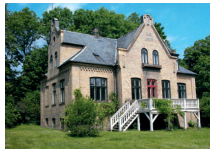
35 Den Gudmannske Villa, Møllevej 5