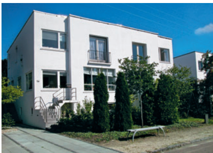
53 Olesvej 12-14