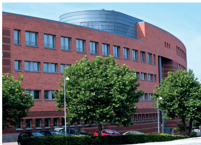
97 Lyngby Port, Lyngby Hovedgade 94-98