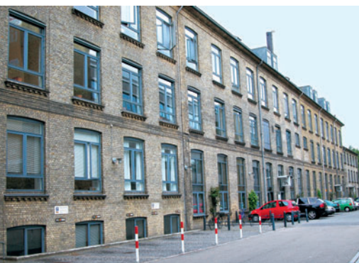
27 Dansk Gardin og Tekstil Fabrik, Gl. Lundtoftevej 1-3