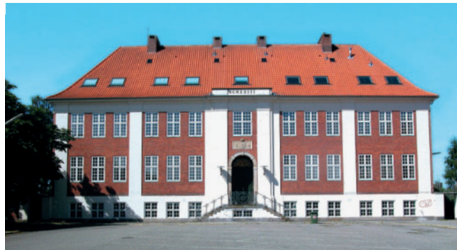
80 Lyngby Statsskole, Buddingevej 50

[81], blev opført i 1959-74 og udbygges fortsat. Området er opdelt i fire kvadranter, der udgør hver sin sektor inden for DTU. Bebyggelsen er sammensat af henholdsvis normalhuse udformet som længehuse i 50 eller 100 meters længde og friere formede bygninger til særlige formål. Arkitekturen er præget af 60'ernes kølige formsprog, men med stor omhu for detaljerne og beplantningen.