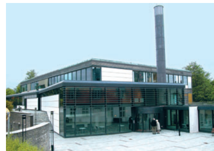
83 Stadsbiblioteket, Lyngby Hovedgade 28