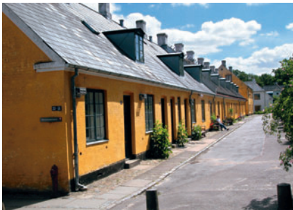
31 Den lange Længe, Brede Allé 33-50

I 2004 gennemførte kommunalbestyrelsen en arkitektkonkurrence om bebyggelse af Badeparken, hvorved arbejderboligerne, kaldet Hyldehaverne, blev nedrivnings-truede.