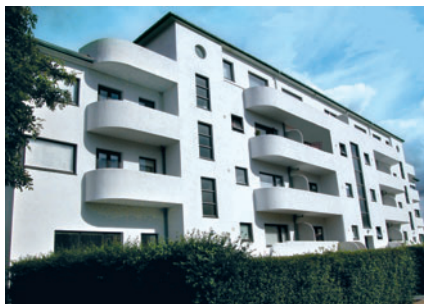
8 Sportshuset, Ulrikkenborg Allé