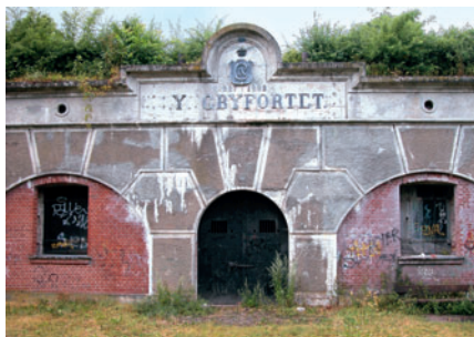
7 Lyngby Fort, Glaciset

Efter besættelsen fortsatte udstykningerne og byggeriet, så kommunen nu er så godt som fuldt udbygget. Samtidig blev den ene industrivirksomhed efter den anden nedlagt, så Lyngby-Taarbæk i dag er blevet et servicesamfund baseret på administration, forskning, uddannelse, rådgivning, handel og service [9].