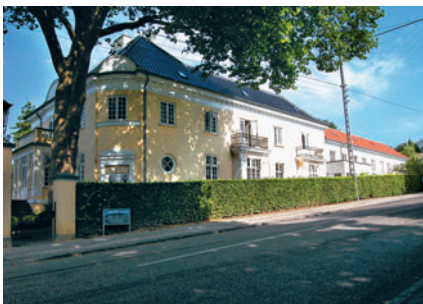
48 Lykkens Gave, Fuglevadsvej 49