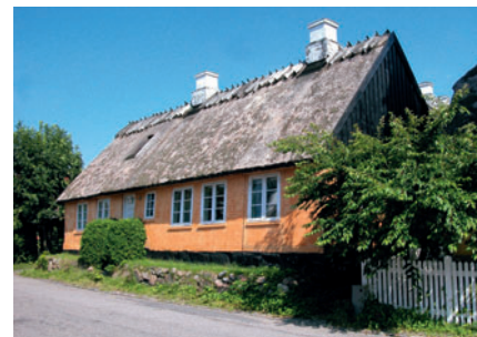
102 Gl. Lundtoftevej 38