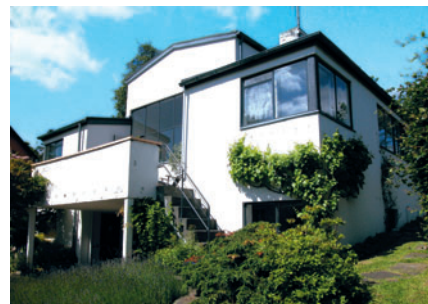
54 I. H. Mundts Vej 16