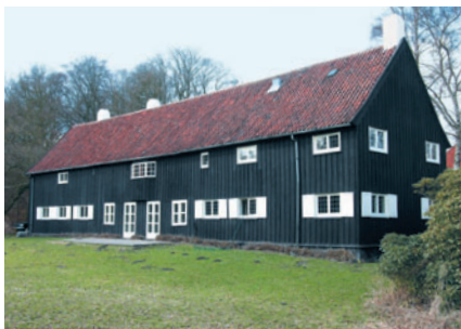
101 Hegnslund, Strandvejen 859

ligger lige højt efter en kvalitativ vurdering.