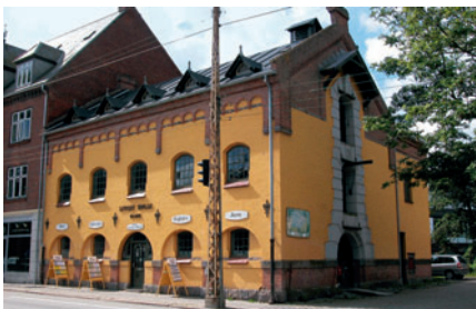
43 Lyngby Sønder Mølle, Lyngby Hovedgade 24