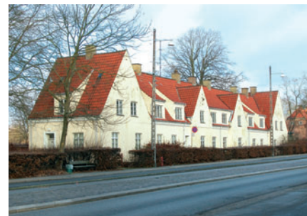
28 Hyldehaverne, Lundtoftevej

Til arbejdslederne blev de såkaldte mestervillaer på Brede Allé 62-65 [32] opført i 1903-04. Arbejderboligerne i »Den lange Længe« på Brede Allé 33-50 [31] blev opført i 1833.