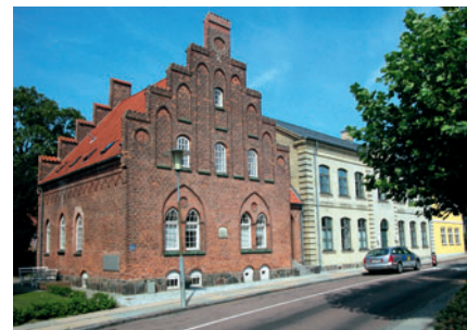
45 Høstvej 1