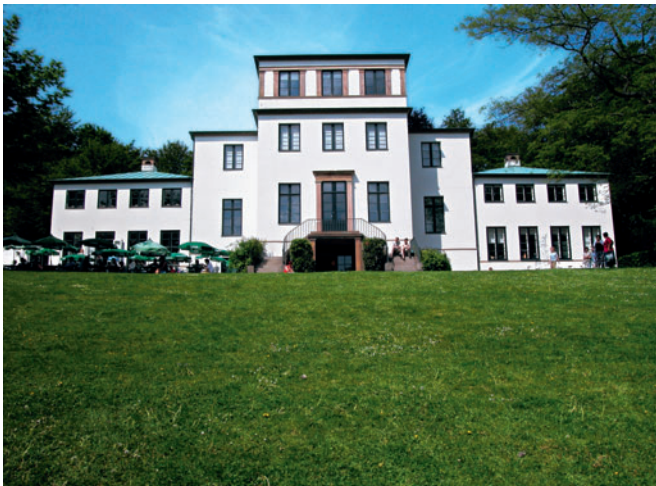
21 Sophienholm, Nybrovej 401