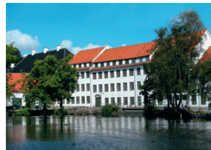
5 Fabrikssamfundet i Brede