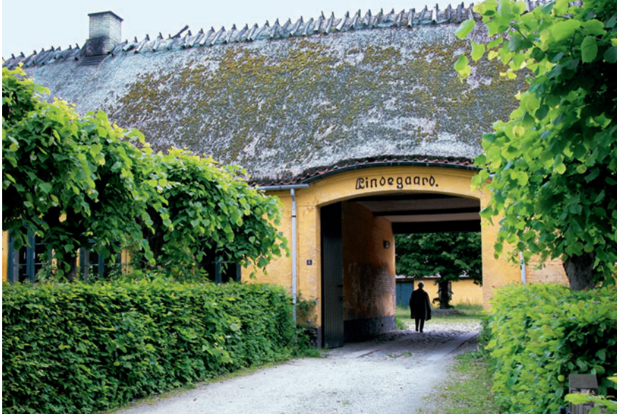
10 Lindegården, Peter Lundsvej 8