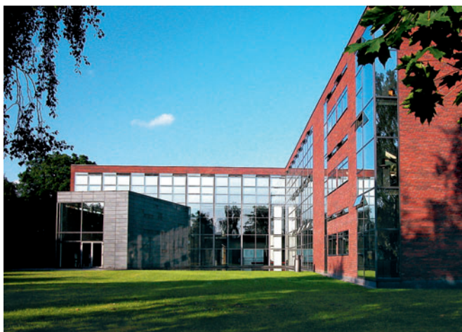
96 E. Pihl & Søn, Nybrovej 116