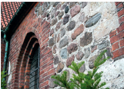
3 Lyngby Kirkes sydmur

boliger, hvoraf mange stadig er bevaret [5]. Med sine ni vandmøller blev Mølleå-dalen ét af Danmarks vigtigste industriområder, hvor der bl.a. blev fremstillet varer af kobber, jern og messing samt produceret