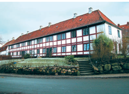
26 Fileværket, Raadvad