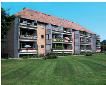
67 Fortunbyen, Lyngvej 57-61

Efter krigen blev et omfattende boligbyggeri sat i gang for at afhjælpe boligkrisen. I Lyngby-Taarbæk var det navnlig boligselskaberne AKB og KAB, som byggede på Københavns Kommunes arealer øst for det centrale Lyngby. Her opstod i anden halvdel af 1940'erne boligkvarteret Fortunbyen, som blev opført i store og varierede landskabsrum, der skaber luft, oplevelsesvariation og flotte udsigter. I Fortunbyen blev højhuset på Lyngvej [66] opført i 1954.