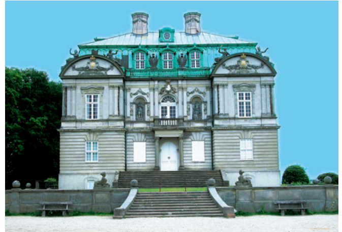
18 Eremitageslottet i Dyrehaven