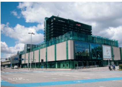
92 Lyngby Storcenter

I 1973 åbnede Lyngby Storcenter [92] som Lyngby-Taarbæks største hus. Det er domineret af store synli-