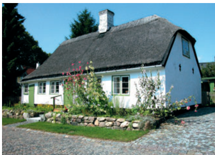
4 Lyngby Stræde 1