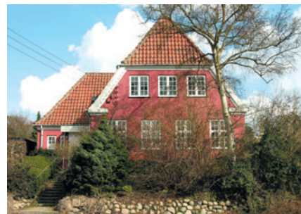
49 Caroline Amalie Vej 12