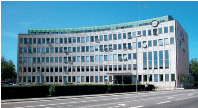
79 Lyngby Rådhus, Lyngby Torv

1941 som erstatning for Kommunebygningen i Åstræde [78]. Facaden er beklædt med grønlandsk marmor og tagetagen med kobberplader. Den stramt disponerede klassicistiske facade brydes kun af indgangspartiet, der er forskudt mod nord i forhold til akse. Rådhuset er placeret i det tragtformede torvs symmetriakse og indfanger med sin krumme facade torvets form. Herved er skabt et veldefineret byrum med en stærk identitet.