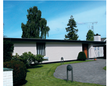
62 Dyrehavegårdsvej 9

Rækkehusene i Granparken er alle bygget i røde sten med mønster af gule sten, mens der i Kulsvierparken også findes rækkehuse i gule sten med mønster af røde sten. Bebyggelserne har relativt flade grå eternittage.