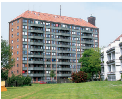
66 Højhuset, Lyngvej 24-28