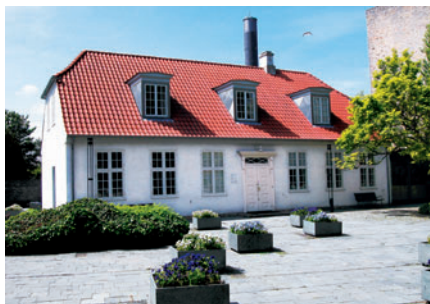
100 Gramlille, Lyngby Hovedgade 28

og Gramlille [100]. Senest blev Bellevue Strandpark [57] og Hegnslund [101] fredet i 2001.