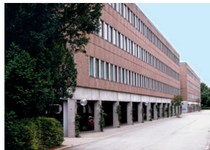
93 Datea, Lyngby Hovedgade 4