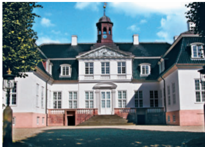
23 Sorgenfri Slot, Kongevejen

Også nogle af bygningerne på de gamle fabrikker ved Mølleåen har stærke klassicistiske træk bl.a. Brede Hovedbygning [30] opført i 1795 og »Kildehuset« i Raadvad opført ca. 1760.