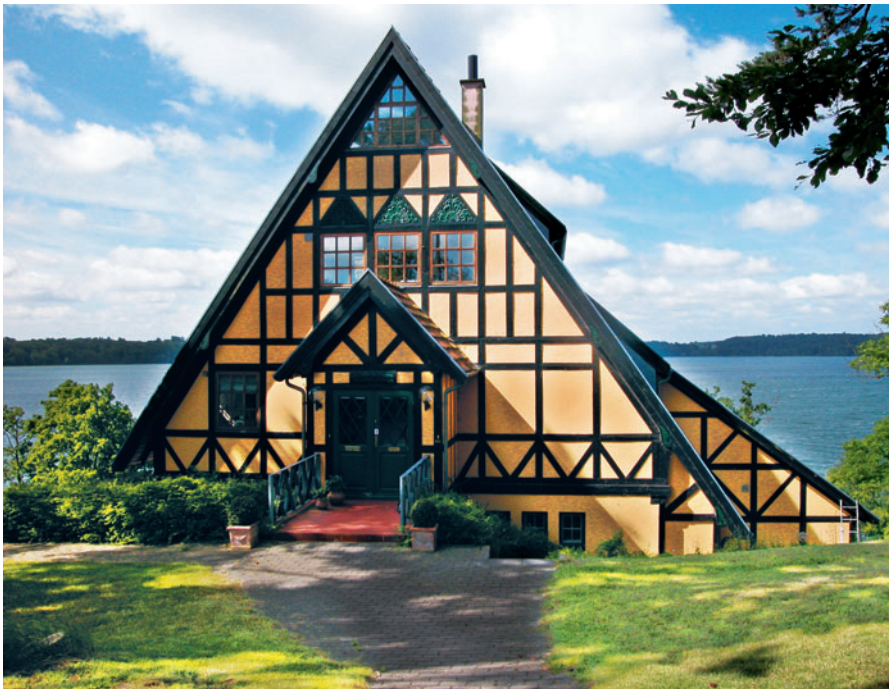
46 Furesølund 18

Nyklassicismen fra ca. 1915-1930, som afløste de romantiske stilarter, gav sig udtryk i en mere nøgtern arkitektur præget af den klassiske old-