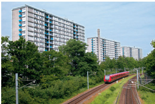
68 Sorgenfrivang II, Grønnevej 253-261

Lundtofteparken [70] blev opført i 1951-57 af boligselskabet Samvirke med 648 boliger i pudset mur og med indbyggede altaner. I 1995 blev