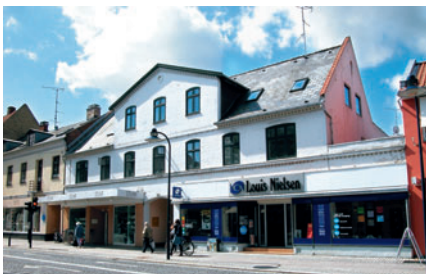
38 Laurits Møllers Gaard, Lyngby Hovedgade 54

Andelsboligforeningen »Toftebækhus« på Lyngby Torv 4-14 [37] blev opført i 1924 i tre etager med pudset mur i nyklassicistisk stil med tegltag og uden kviste. Den havde oprindeligt fire butikker og 32 lejligheder.