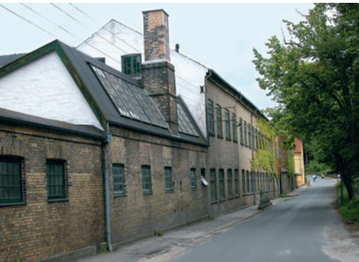
25 Raadvaddam Fabrik, Raadvad