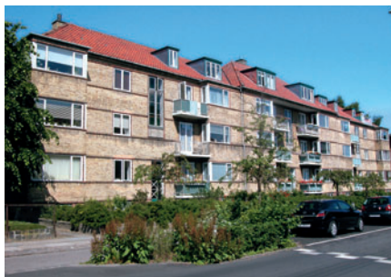
50 Pipers Park, Ulrikkenborg Allé