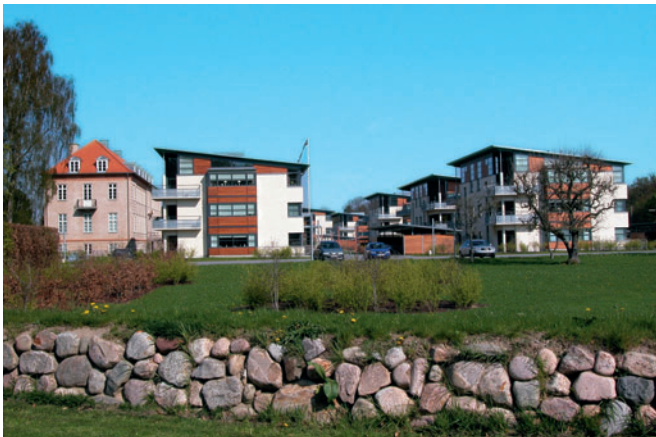
87 Dronningens Vænge