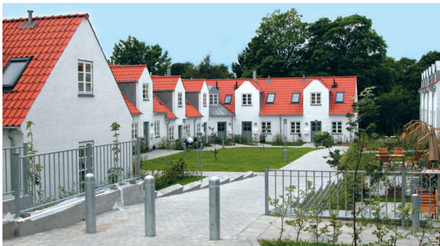
90 Havegærdet i Bondebyen

debyen [90] er opført i 2004 som en rækkehusbebyggelse i halvanden og to etager med 16 boliger. Husene har hvidskuret mur, rødt tegltag og frontkviste beklædt med vingetegl. Lyngby-Taarbæk er i dag et meget