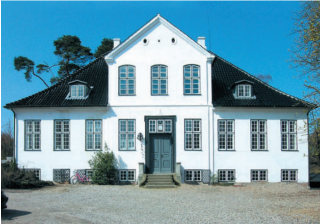
17 Ørholm Hovedgaard, Ørholmvej 61