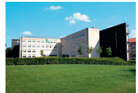
94 Bayer Danmark, Nørsgaardsvej 32